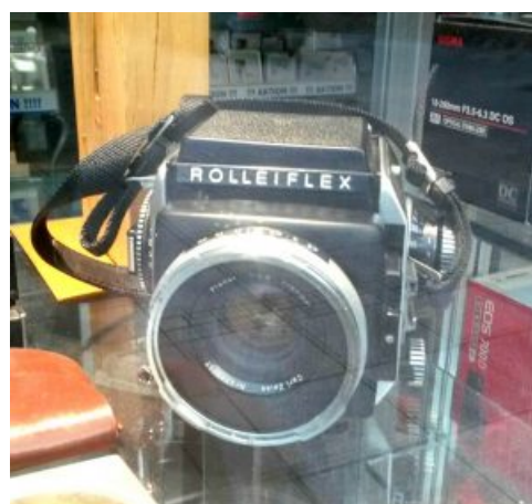
Zum Beispiel hier das Model SL66

Er erzählte davon, wie er an den Wochenenden nach Herford in den Jaguar-Club fuhr. Den Eintritt in diesen entrichtete er, indem er von den Stars mit der Rolleiflex seines Großvaters Fotos machte und an die Club-Besitzerin abgab.