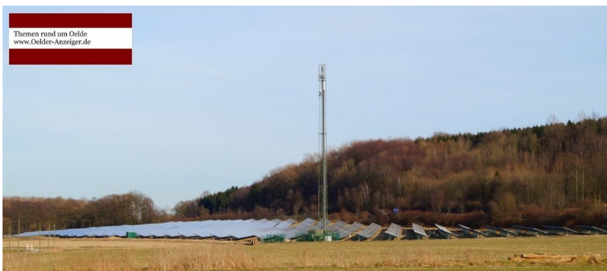
Solaranlage in der Bauernschaft Bergeler