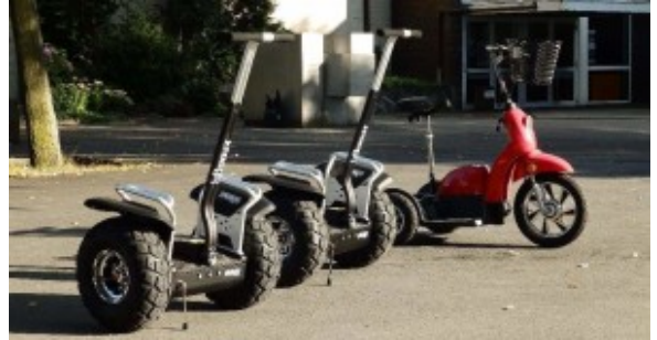
Beispiel von Werner Schuberts Elektro-Fahrzeugen

wird der Oelder Marktplatz in der Zeit von 13.00 - 18.00 Uhr zur Klimaschutzzone erklärt. Es wird Informationen zu erneuerbaren Energien, Energieeinsparungen und die Mobilität von morgen kann erprobt werden.