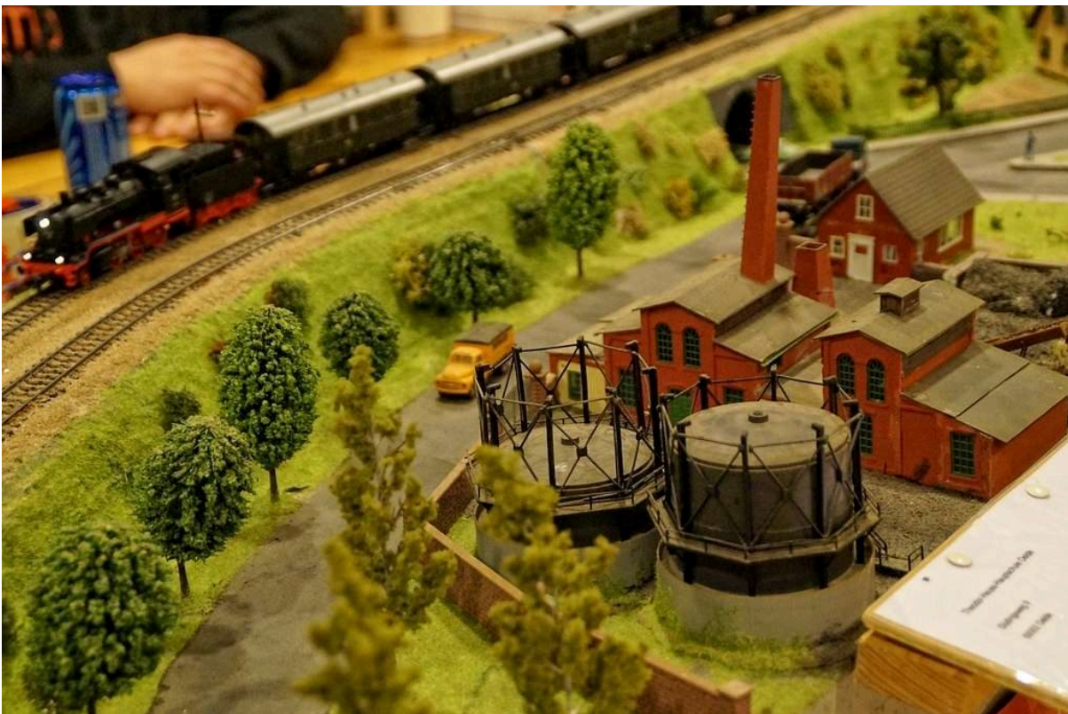
Das alte Gaswerk

des Weihnachtsmarktes war die Modelleisenbahnausstellung der Theodor-Heuss-Hauptschule aus Oelde. Die Schüler haben Ende der 90er Jahre mit dem Projekt „Bau einer Eisenbahn“ begonnen, die vielen Oeldern gefallen wird. Die ca. 15 Meter lange Eisenbahn verläuft U-förmig.