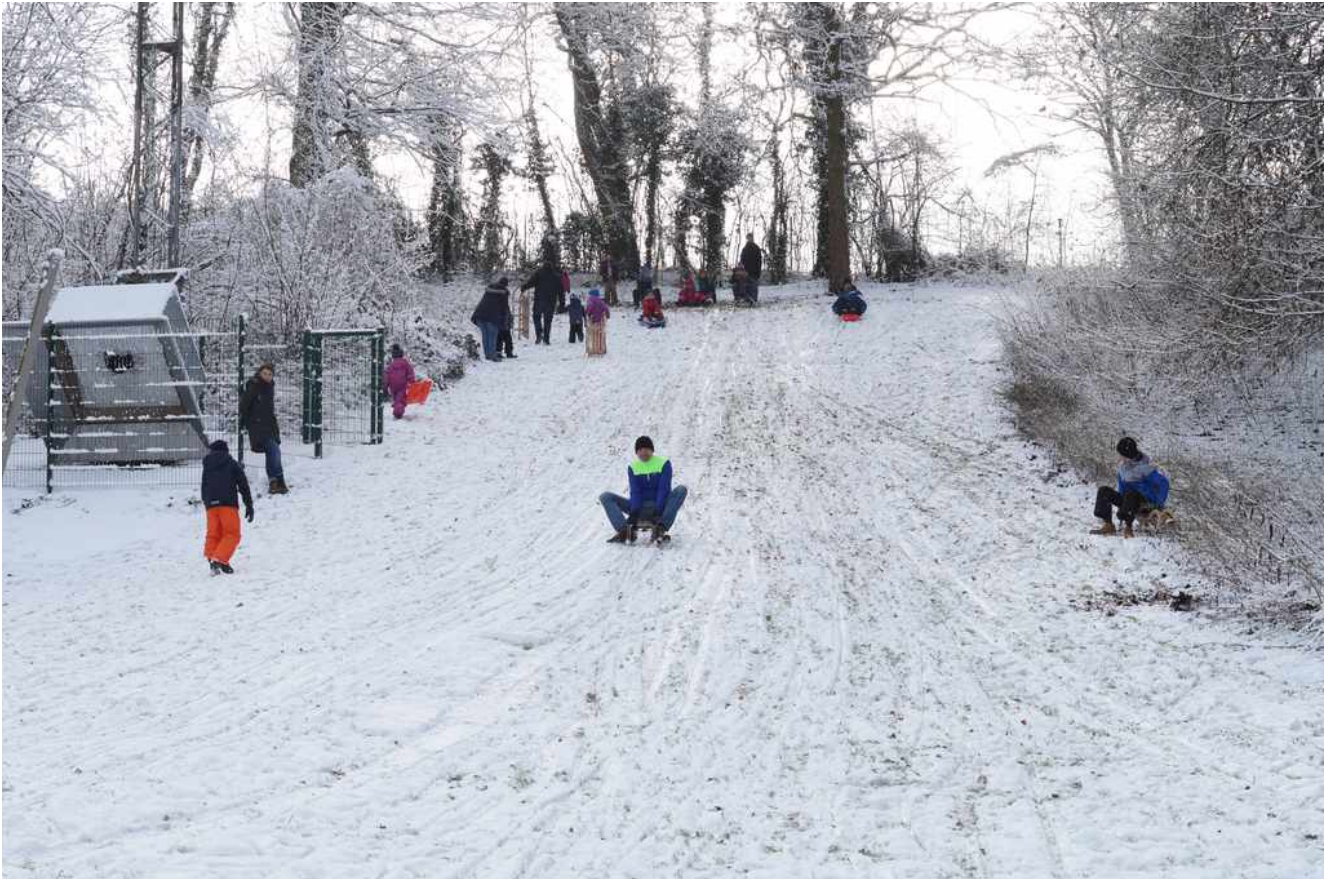
Am Hügel war ordentlich was los