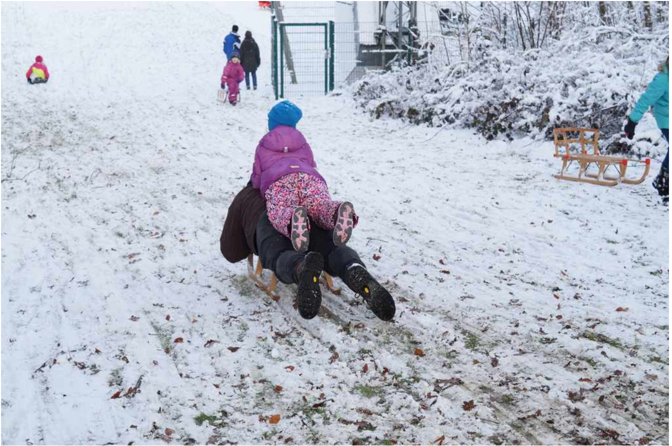
Ein Vater - Kind - Doppeldecker