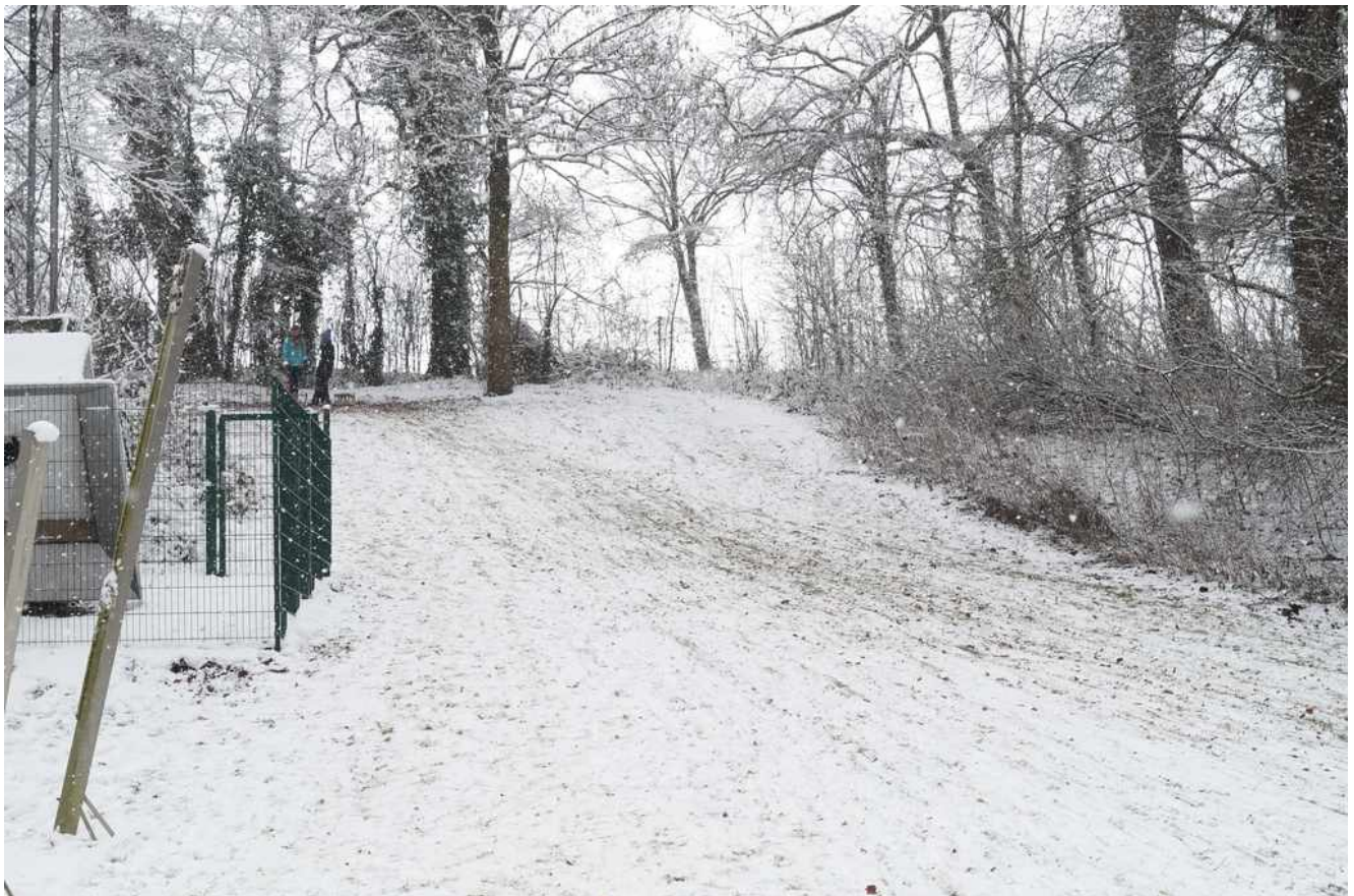
Der Hang am Schützenplatz

In der Nacht vom 14. auf den 15. Januar wurde Oelde über Nacht in ein weißes Kleid getaucht. Die Schneemenge reichte bei vielen Kindern aus, um den Schlitten aus dem Keller zu holen, die Kufen zu wachsen und sich Richtung Schützenplatz aufzumachen am Rande des Vier-Jahreszeiten-Parks.