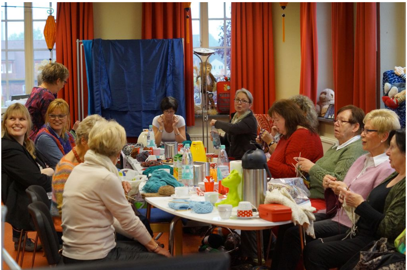
Die Frauen vom Nadelspiel

Viele kennen das Stricken von daheim, wenn die Mutter oder die Oma die Nadeln haben fliegen lassen. Man könnte meinen, dass es sich hierbei um ein antiquiertes Hobby handelt. Doch der OELDER ANZEIGER wurde beim Besuch des Handarbeitstreffens in der Stadtbücherei Oelde eines Besseren belehrt. Ein gemütlicher, lustiger Haufen von Damen kreiert wunderschöne Unikate für den persönlichen Bedarf oder guten Zweck mit den eigenen Händen im Leseraum der Stadtbücherei Oelde.