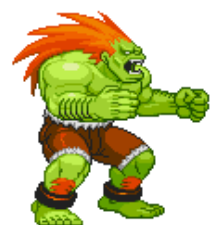
Blanka aus Street Fighter II

Sahra Wagenknecht lässt wie einst Chun Li ihren Slip beim Sprung-Kick blitzen oder nutzt die „Soli-Sense“, während sich Schulz zu einem Kinnschlag in die Lüfte windet wie Mr. Bison mit seinem Tiger Uppercut.