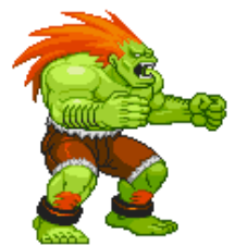
Blanka aus Street Fighter II

Sahra Wagenknecht lässt wie einst Chun Li ihren Slip beim Sprung-Kick blitzen oder nutzt die „Soli-Sense“, während sich Schulz zu einem Kinnschlag in die Lüfte windet wie Mr. Bison mit seinem Tiger Uppercut.