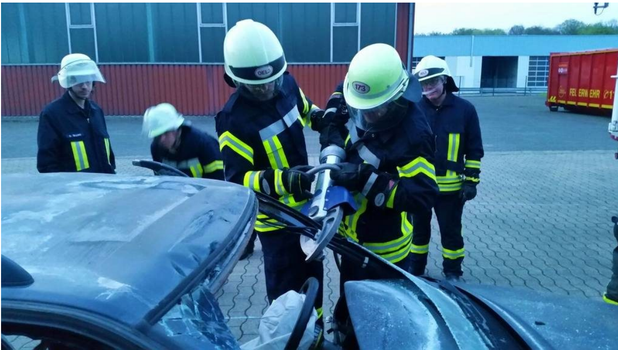
Übungen am PkW

Mit einem lachenden und einem traurigen Auge berichteten uns die Männer, wie sie selber Fahrzeuge reparierten oder speziell umbauten. Der Abbruch der Stimmung und die Quittierung des Dienstes könnte jedenfalls nachvollzogen werden. Jahrzehntlang wurde hier ehrenamtlich der Brandschutz betrieben.