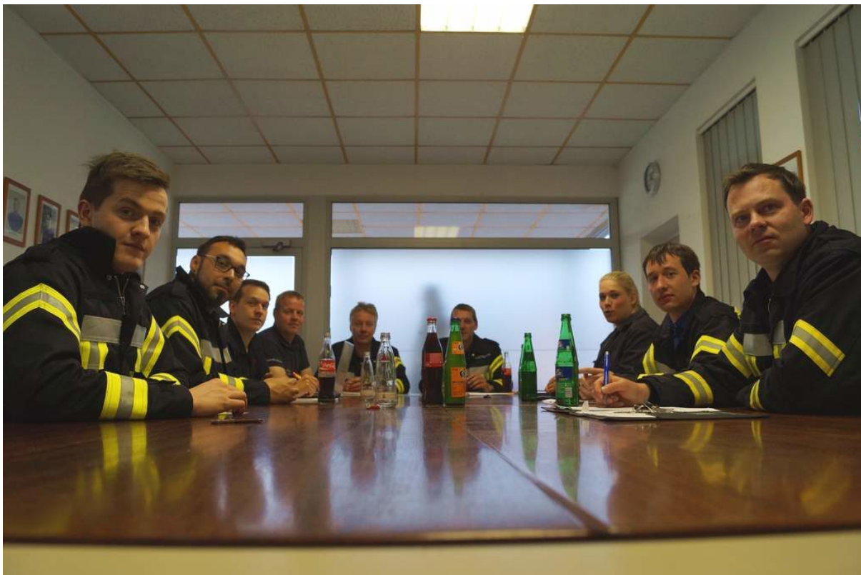
Ernste Gesichter beim Löschtrupp