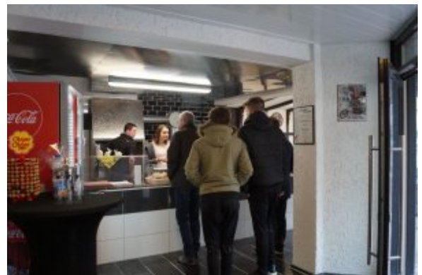
Die ersten Gäste stehen an im neuen Grill

Am Erfolgskonzept der Oelder Bratwurstschmiede ändert sich nichts.