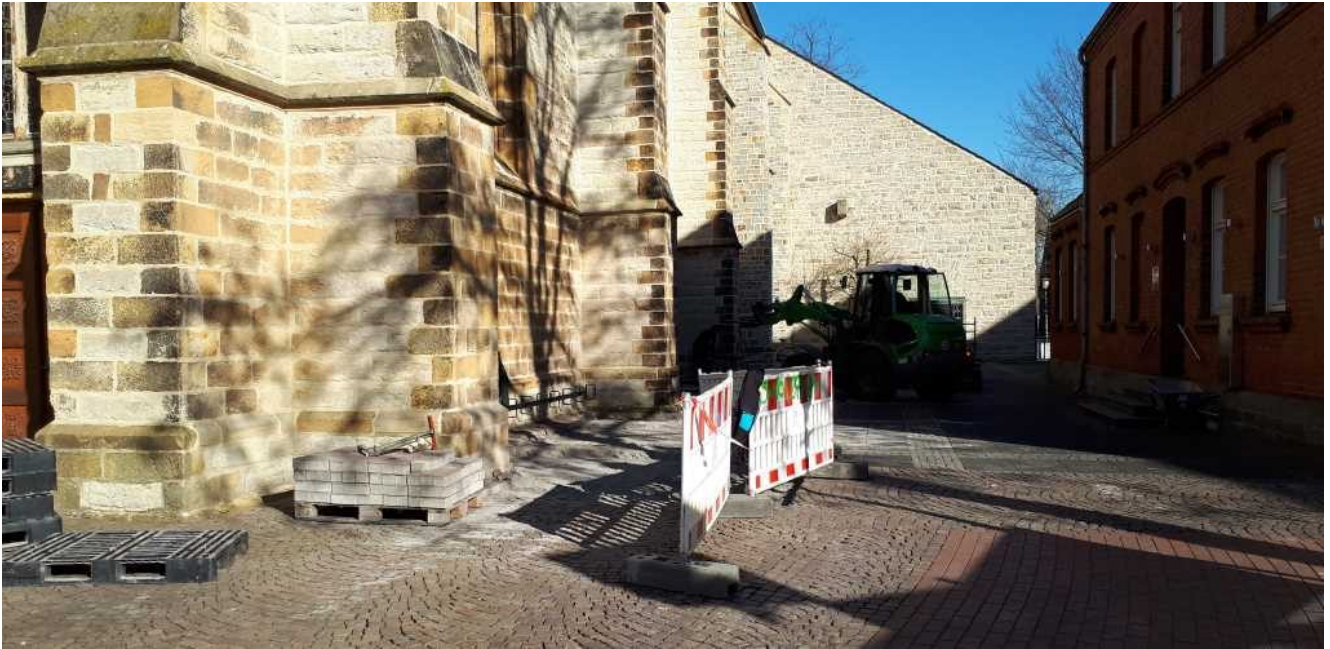
Musterpflasterfläche am 27.02.2019 neu verlegt

Nachdem wir Initiatoren alle Hürden eines Bürgerbegehrens erfolgreich genommen hatten, wurde das uns - nach Gemeindeordnung NRW - zustehende Recht durch einen Formfehler der städtischen Verwaltung maßgeblich genommen. Weder wir Initiatoren noch die Wähler tragen daran irgendeine Schuld. 28 Wahlbriefe konnten erst nach Beendigung des Bürgerentscheids dem Rathaus zugestellt werden und hätten bei rechtzeitiger Zustellung durchaus zu einem Erfolg des Bürgerentscheids führen können, denn bei den bisherigen Briefwahlstimmen machten die 1.612 Ja-Stimmen einen Anteil von deutlich über 50% aus. Uns wurde durch den Formfehler der Stadt die Möglichkeit genommen, zu überprüfen ob die 28 nachträglichen Wahlbriefe die erforderlichen 6 Ja-Stimmen beinhalten, um das Quorum von 20% zu erreichen.