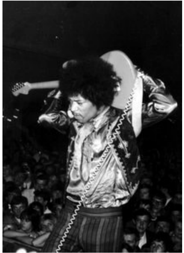
Jimi Hendrix lockte am 28. Mai 1967 hunderte Jugendliche in den Herforder »Jaguar-Club«