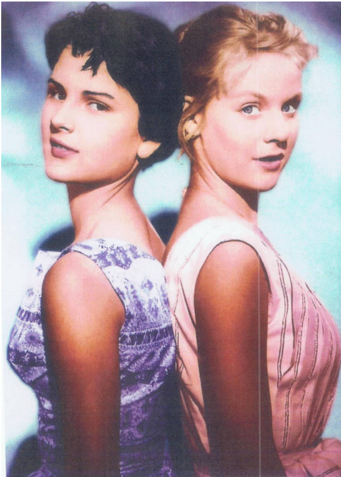
Dick und Dalli (c) Immenhof Museum Mario Würz

und im Nottbecker Museumsshop erhältlich ist.