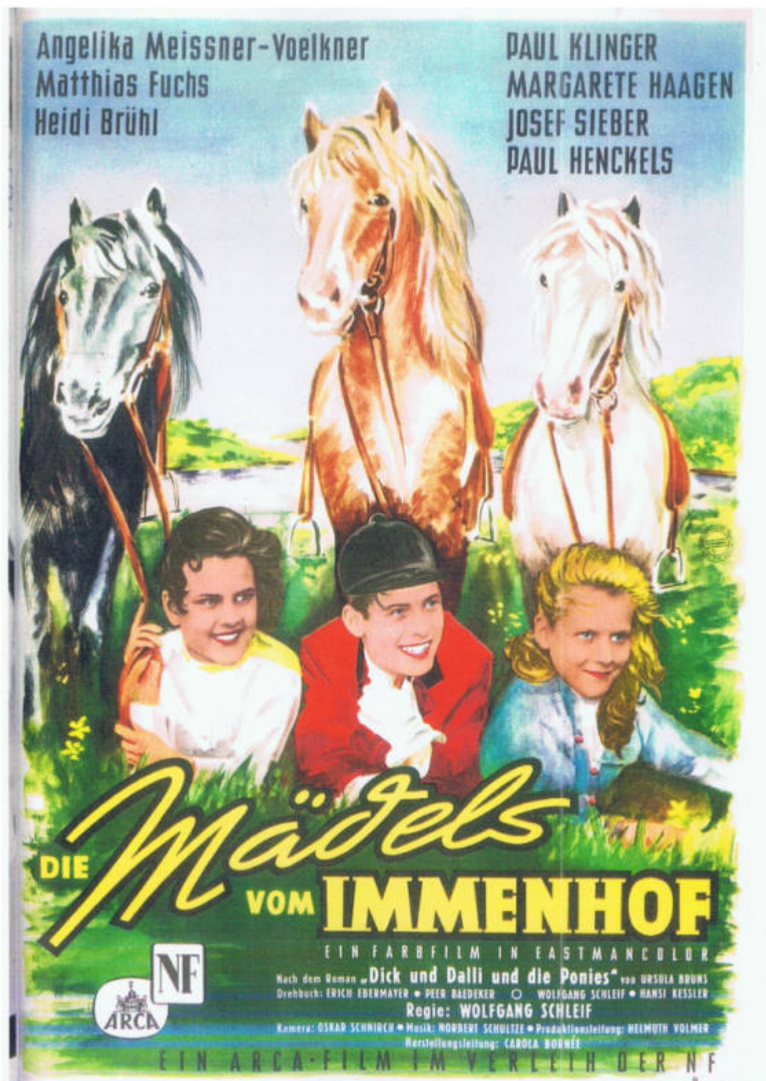
Plakat Mädels vom Immenhof