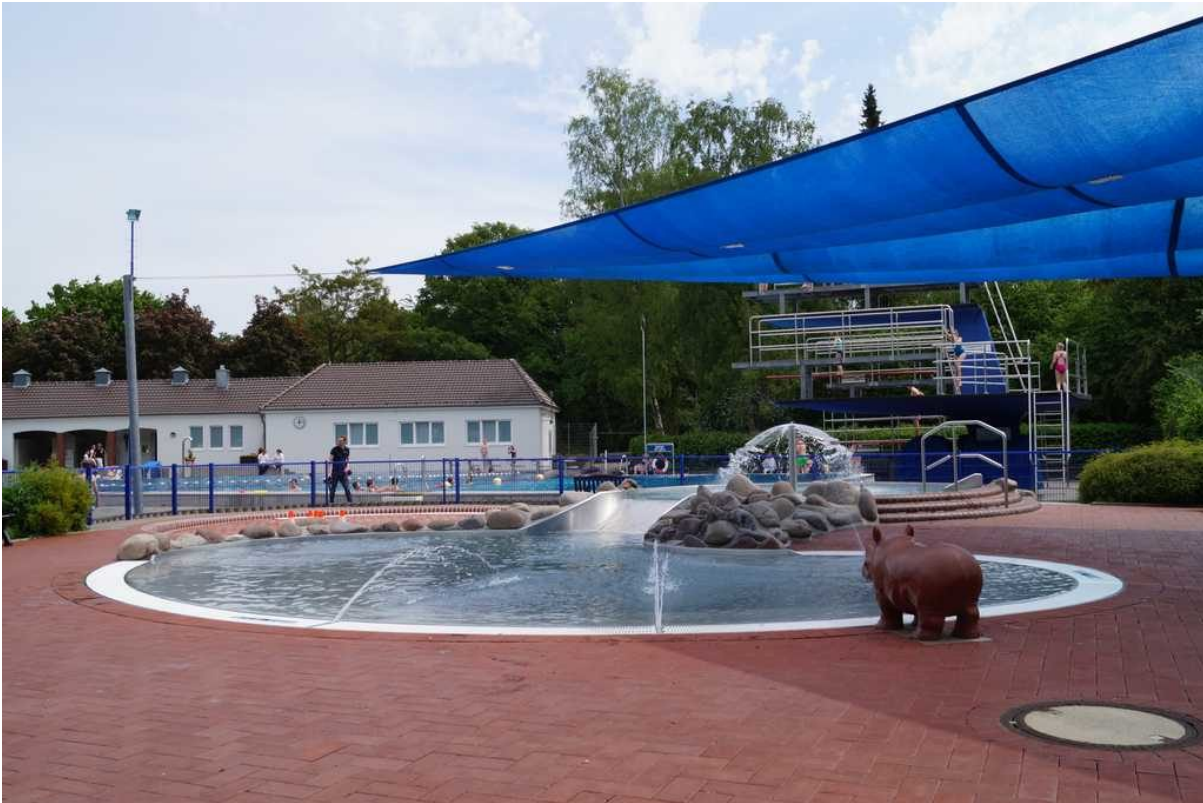
Links markieren Bauhütchen den Platz der fehlenden Rutsche