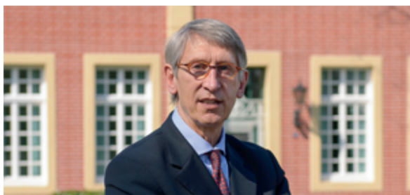
Bürgermeister Karl Friedrich Knop

In der Ratssitzung sagte Bürgermeister Knop jedoch zu, erneut einen Versuch zu machen, erneut mit dem Handel ins Gespräch kommen zu wollen, um die grundsätzliche Bereitschaft erkunden zu wollen, sich an einem derartigen Projekt beteiligen zu wollen.