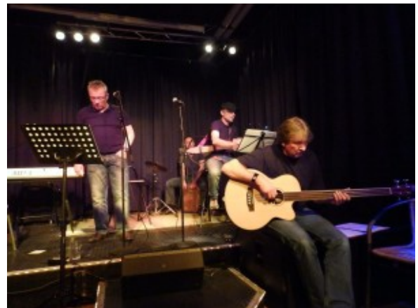
Die „Liquid Solids“ in Aktion in der Alten Post Oelde

Mal singt nun schon seit vielen Jahren auf Hochzeiten, Geburtstagen, Festen und bei Veranstaltungen. Im Jahre 2005 führte er bei der GEA Westfalia Separator Group GmbH, bei der er auch arbeitet, ein Casting für die „The GEA Allstars“ durch. Bei dem Casting fanden sich für die Band 18 musikalische Mitglieder aus allen Ländern und Töchtergesellschaften, die seither bei Meetings und Firmenfesten spielt.