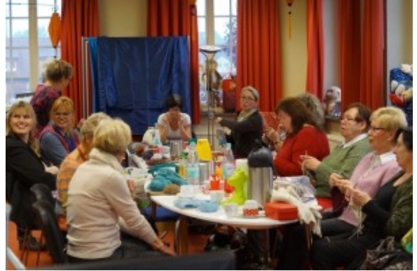
Archivaufnahme aus 2015

Die nun 3. Modenschau präsentiert das Nadelspiel an diesem Mittwoch und es wird eine Reise von Spätsommer bis in den Herbst/Winter sein. Vom Tuch bis zur Long-Strick-Jacke ist alles zu sehen. Lassen Sie sich inspirieren von den Modellen, den Farben, Mustern und Formen und den Büchern der Bibliothek. Der Herbst kommt, und möglicherweise entdecken Sie ein neues Hobby Handarbeiten für sich. Die Modenschau wird draußen stattfinden. Sitzmöglichkeiten sind selbstverständlich vorhanden.