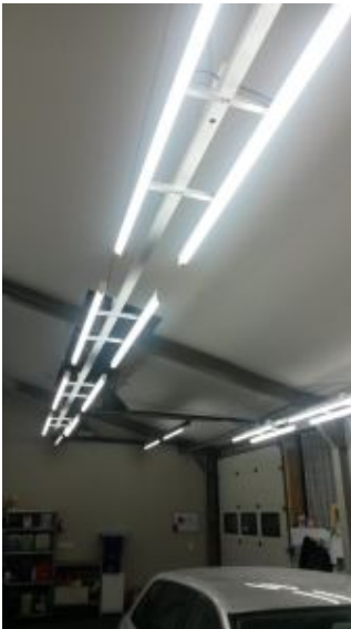
Licht sorgt für gute Arbeitsbedingungen

Der erste Platz erhält eine Premium-Innenreinigung im Wert von 50 €. Diese beinhaltet die Reinigung der Sitzschienen, Pedale, Tankdeckel, Armaturen (keine