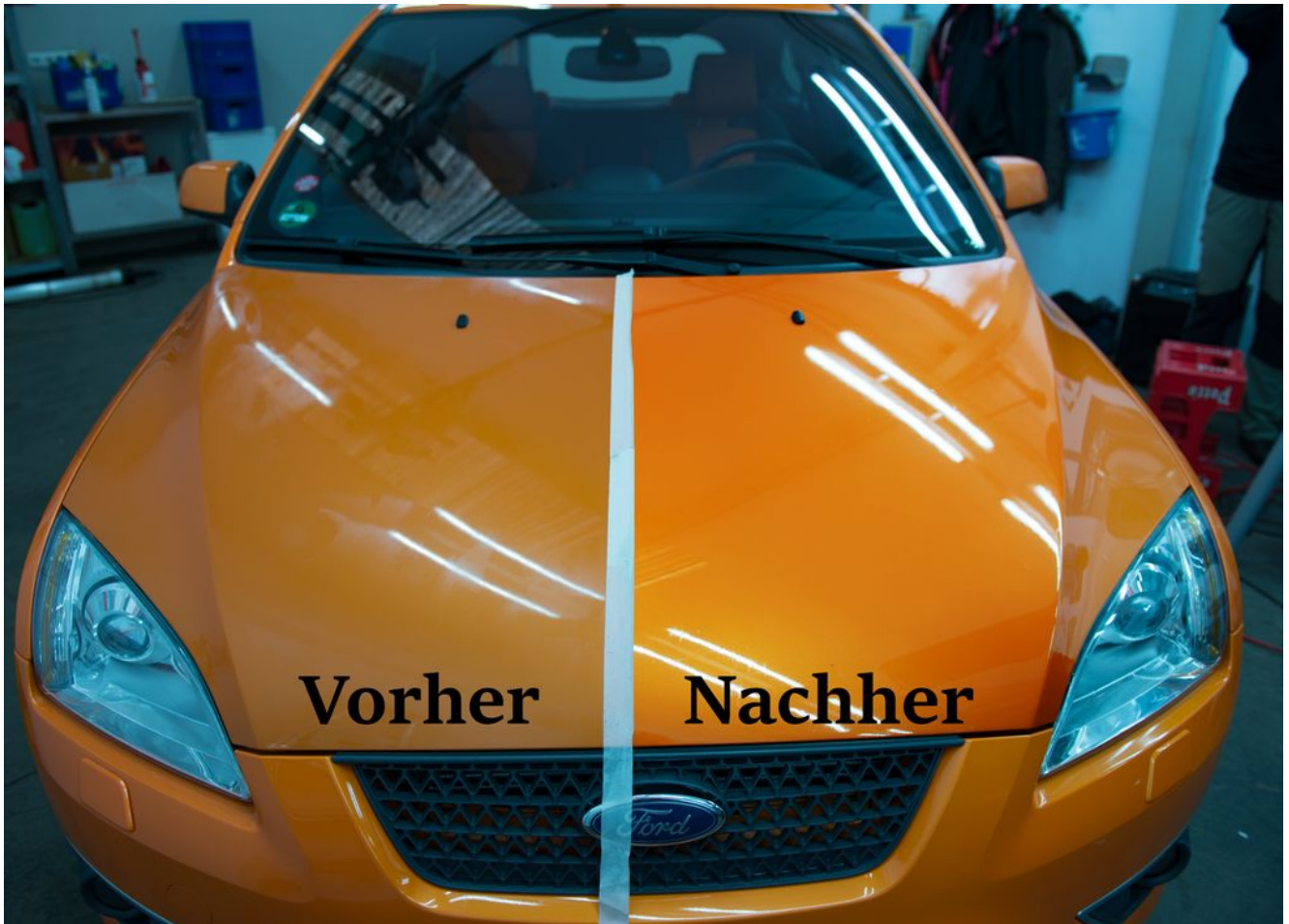
Ein Unterschied wie Tag und Nacht