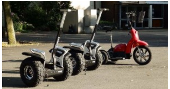
Beispiel von Werner Schuberts Elektro-Fahrzeugen

wird der Oelder Marktplatz in der Zeit von 13.00 - 18.00 Uhr zur Klimaschutzzone erklärt. Es wird Informationen zu erneuerbaren Energien, Energieeinsparungen und die Mobilität von morgen kann erprobt werden.